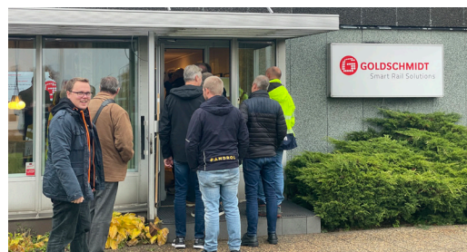
Huvudingång till Goldschmidt

Den gemesamma middagen på kvällen blev i vanlig ordning en av höjdpunkterna med möjlighet till ett trevligt nätverkande.