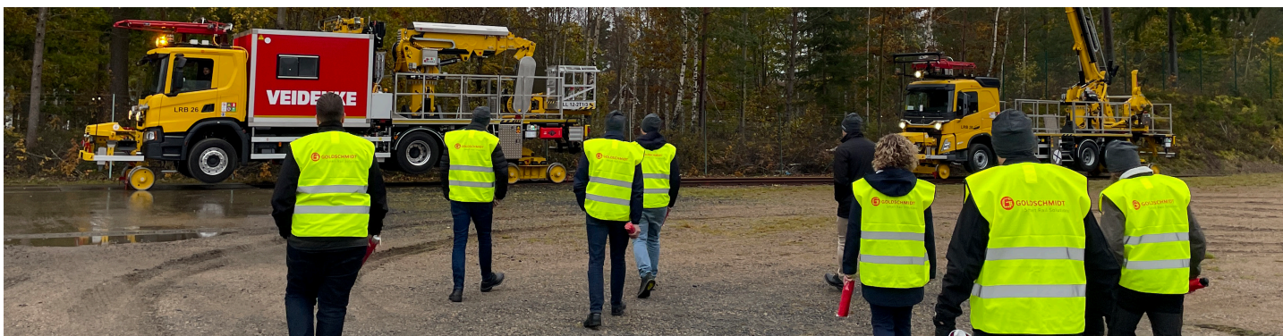
Demonstration av den elektriska rälslyftbilen

Medlemsmötet till våren kommer att genomföras den 16-17 april hos Malux Sweden AB i Örnsköldsvik.