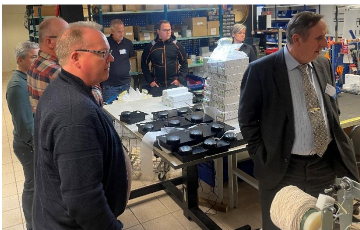
Bilden är från studiebesök i Malux verkstad vid medlemsmötet den 16 april 2024

På agendan står bland annat Trafikverket, som kommer att tala om elektromagnetisk kompatibilitet (EMC) för spårfordon och TSA. De kommer även att informera om det pågående SAS-projektet, och ett sammandrag av en del av detta projekt kan du läsa längre ned i nyhetsbrevet.