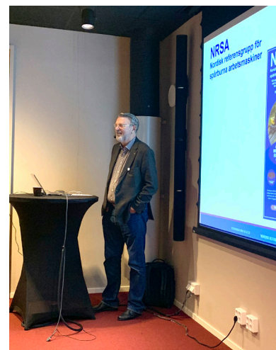
Medlemsmöte i Stockholm med STHK som värd företag den 22 oktober 2019